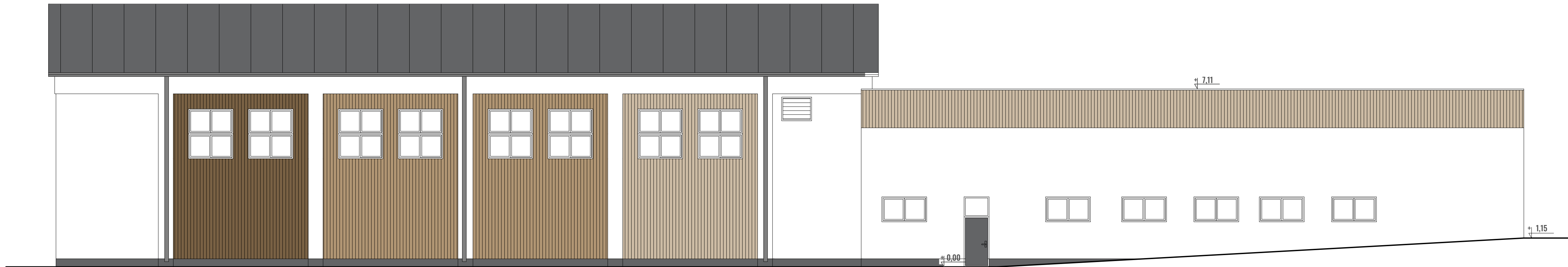
6- rozwinięcie elewacji wschodniej